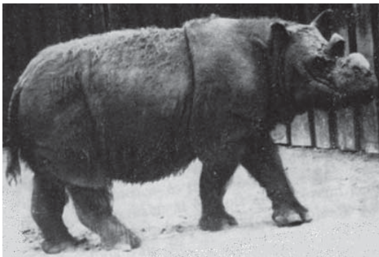
3. ábra. Szumátrai orrszarvú (ANGHI 1964), melyet a HNHM 68.583.1. számú példánynak gondoltak Fig. 3. Captive Sumatran rhino (ANGHI 1964) thought to be the HNHM 68.583.1. specimen