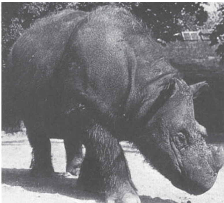
4. ábra. „Subur” szumátrai orrszarvú a koppenhágai állatkertben (GROVES & KURT 1972) Fig. 4. “Subur”, the Sumatran rhino of the Copenhagen Zoo (GROVES & KURT 1972)