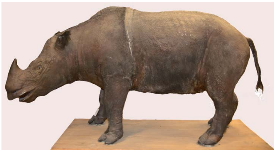
1. ábra. Az MTM montírozott Dicerorhinus sumatrensis sumatrensis példánya (HNHM 68.583.1.)