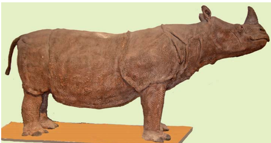
5. ábra. Az MTM montírozott Rhinoceros sondaicus sondaicus példánya (HNHM 1100.107) műanyag tülökkel

A HNHM 1100.107 példány méretei (a montírozott állaton utólag felvéve) a következők: marmagasság 130 cm, teljes testhossz 300 cm, farokhossz 50 cm.