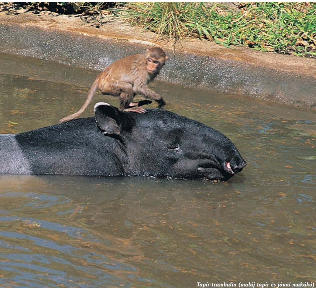
Tapír-trambulín (maláj tapír és jávai makákó)