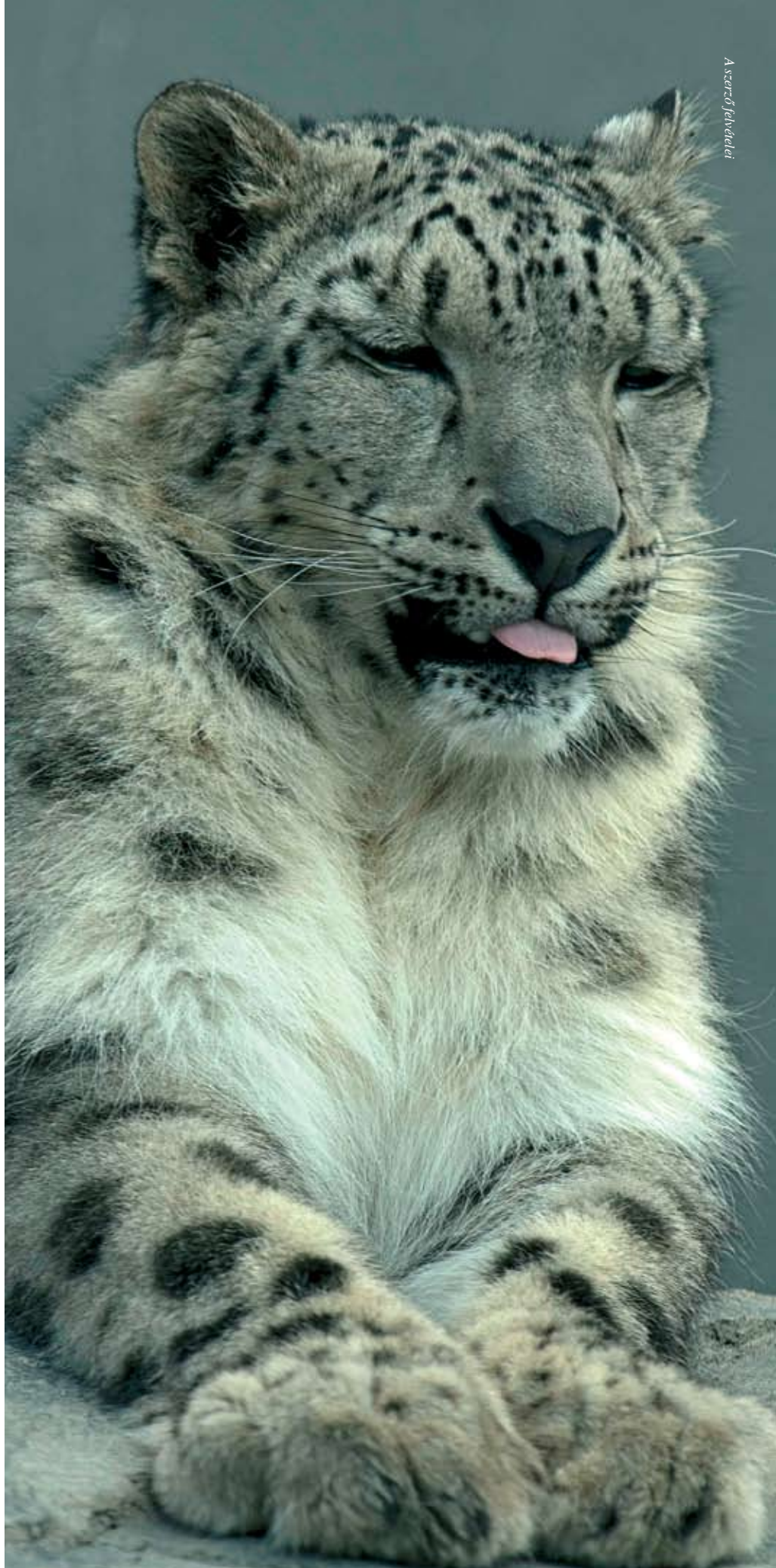
A szőrű felvételei