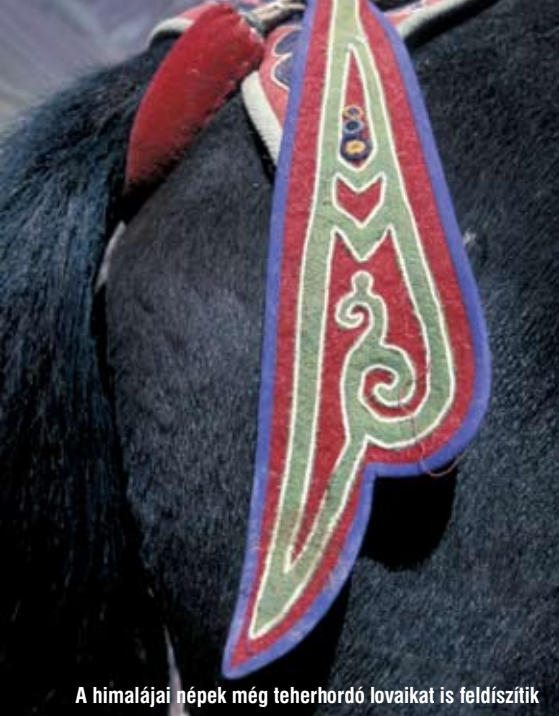
A himalájai népek még teherhordó lovaikat is feldíszítik

Hópárducbundából készült kucsma Kirgizisztánban.