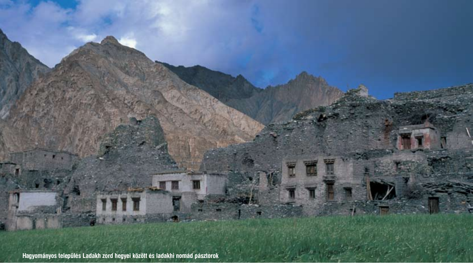
Hagyományos település Ladakh zord hegyei között és ladakhi nomád pásztorok