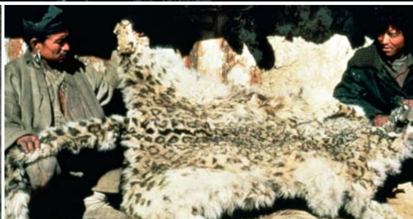
A nepáli piacokon még napjainkban is fel-felbukkan egy-egy hópárducbőr.

nak, de elesnek ettől, ha csak egyetlen tagjuk is megsérti a szabályokat. Jelenleg Mongóliában 350 háztartás készít tevé- és juhszőrből gyerekcipőket, kézzel hímzett kispárnákat, színes pokrócokat és poháralátéteket. Persze nem hiányoznak a választékból a színes és puha fonalak vagy a hópárducot és kőszáli kecskét mintázó karácsonyfadíszek sem, amelyek már nem csak az adott országba látogató turisták részére készülnek. A Kirgizisztánban, Mongóliában vagy Pakisztánban készült kézműipari termékek nemzetközi értékesítését az ISLT seattle-i irodája végzi, és ebbe a programba elsősorban a hópárducokat bemutató állatkerteket szeretné bevonni.