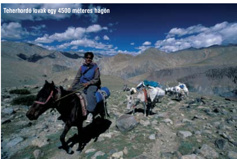
Teherhordó lovak egy 4500 méteres hágón