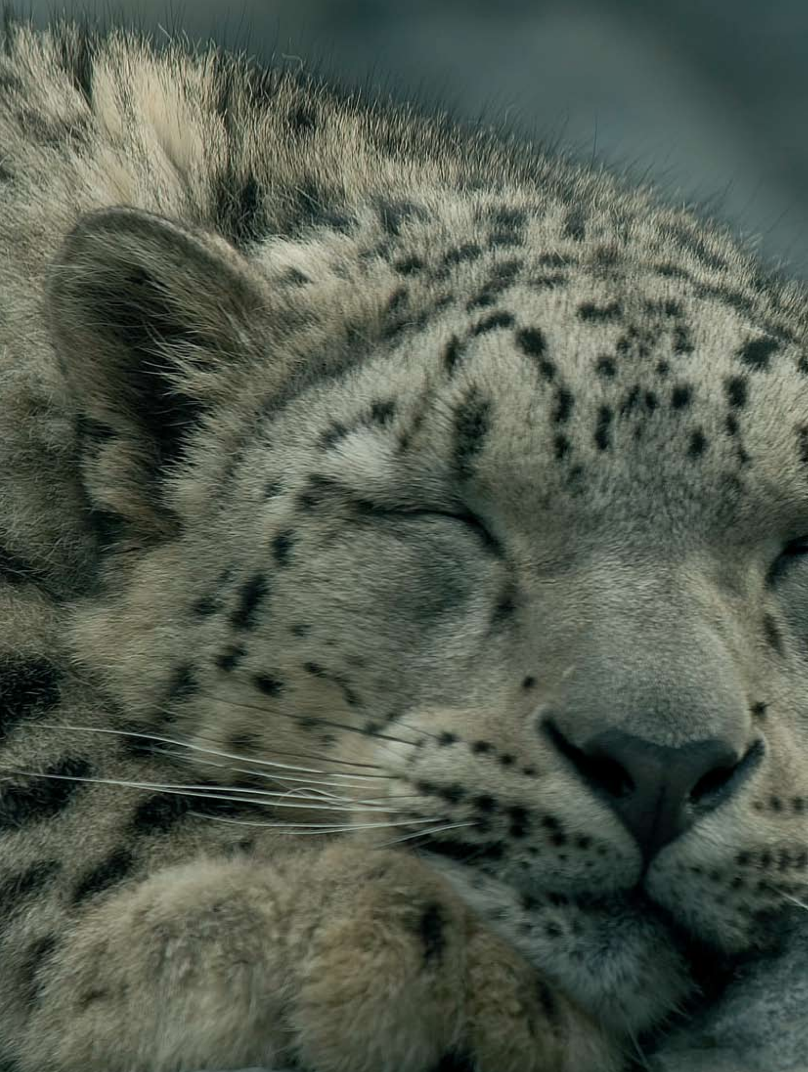
Pihenő hópárduc az angol Rare Species Conservation Centerben. Ez a kis állatkert csekély méretei ellenére is lelkes támogatója a Snow Leopard Trust-nek