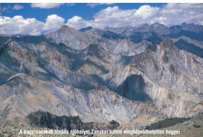
A nagymacsák ideális élőhelyei Zaskar szinte megközelíthetetlen hegyei

Mongóliában egy év alatt 12 családot szerveztek be, amíg Kirgizisztánban két év alatt több mint 250-et. Általánosságban elmondható, hogy a családok bevételei mintegy 40%-al emelkedtek, ami bőven elég a jobb életszínvonal fenntartásához. Az értékesítéséből befolyt összegből a sikeresen teljesítő közösségek év végén további 20%-os bónuszt kap-