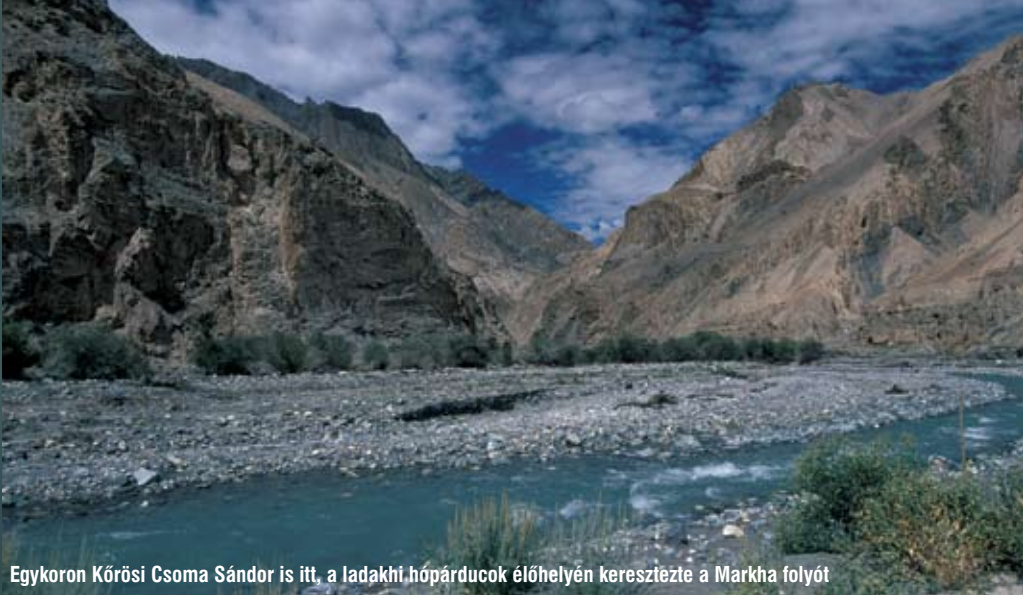
Egykoron Kőrösi Csoma Sándor is itt, a ladakhi hópárducok élőhelyén keresztezte a Markha folyót

Az állatkert-látogatók millióinak csodálatát elsősorban nem a hópárduc ( Uncia uncia ) ritkasága, hanem bundájának szépsége váltja ki. Erre sajnos még hazánkban is van kereslet, aminek bizonyítékául szolgálnak az elmúlt évtizedekben a magyar hatóságok által elkobzott és jelenleg a Magyar Természettudományi Múzeum gyűjteményében őrzött hópárducbőrök. E pompás macska élőhelyének mind a 12 országában szigorúan védett fajnak számít, kivéve Mongóliát, ahol nem is olyan régen még a vadászata is megengedett