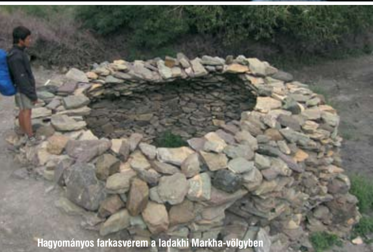
Hagyományos farkasverem a ladakhi Markha-völgyben