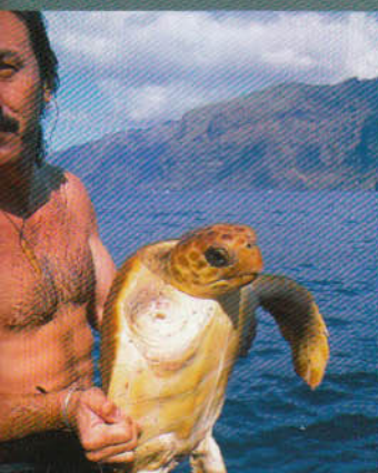
A kutya 13 szigete