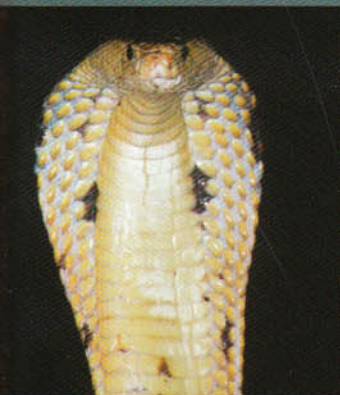
Boxmérkőzés a királlyal