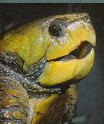
Nagyfejű iszaplakó a terráriumban