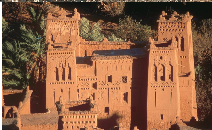
Fent: Ait Benhaddou számos film forgatási helyül szolgált, a kontinens legnagyobb filmgyára is itt található.

EKKORA MAGASSÁGBAN már gyakran előforduló egészségügyi probléma a