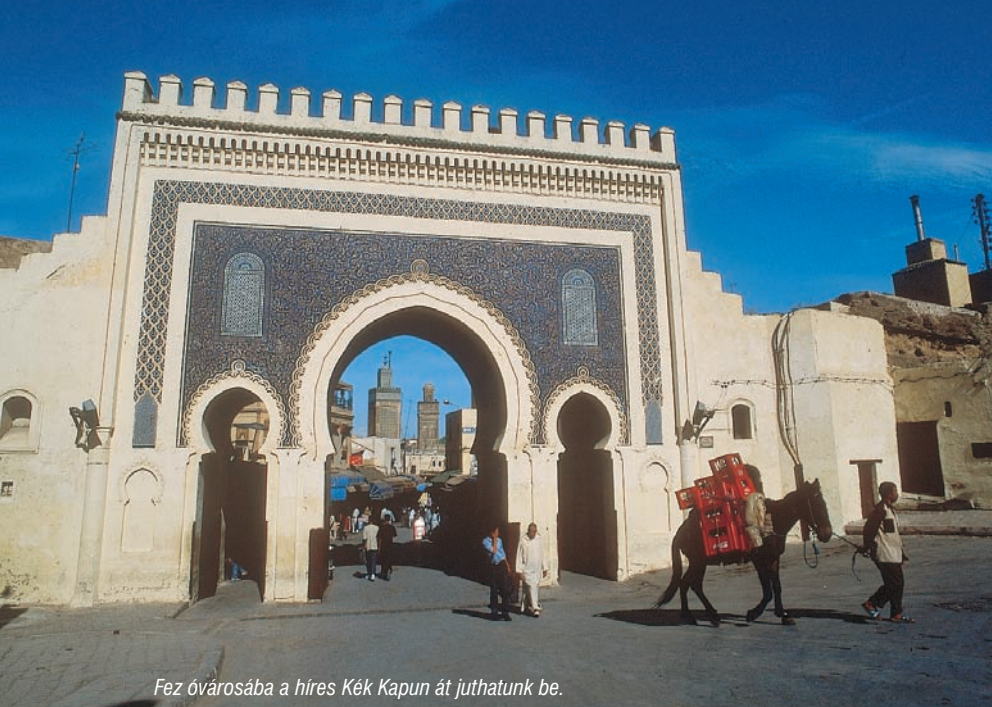
Fez óvárosába a híres Kék Kapun át juthatunk be.

üzem után némiképp átértékelődik bennünk a munka fogalma. A fezi festőkádákat a római idők óta használják, és az emberek még ma is a cserző- és festőlében állva végzik munkájukat. A festés végén a bőröket szamarakra pakolják, és a szomszédos lapos háztetőkön, a napon szárítják ki.