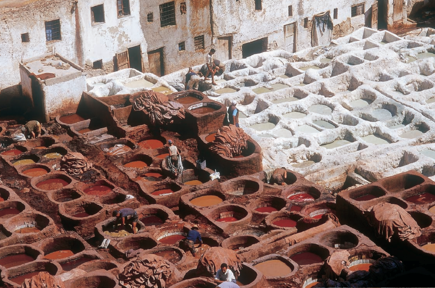
A legtöbb turista Fez legnagyobb bőrcserző üzemét, a XI. századi Tanneries Chouarát keresi fel.

henünk le, de az éjszaka már a dűnék között megbúvó apró oázisban ér bennünket. Hajnalban kelünk, és kicsit kókadtan, de fölmászunk a legmagasabb dűnékre, hogy onnan nézzük a napfelkeltét. Az elmaradhatatlan kólaárustól siléct és hódeszkát kölcsönzünk, és egy, a dűnén keresztben fekvő szerelmespár nem kis rémületére le-siklunk reggelizni.