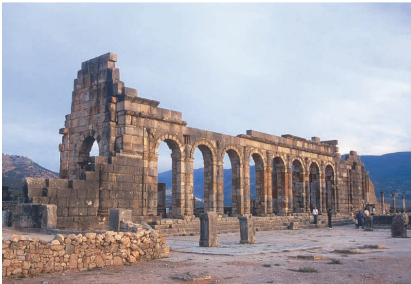
A Caligula római császár alapította Volubilis egykor a rómaiak afrikai jelenlétét biztosította. Ma az oszlopokon fészkelő gólyák és a falakon rohangáló agámák székhelye.

(A szerző a Baraka Utazási Iroda munkatársa.)