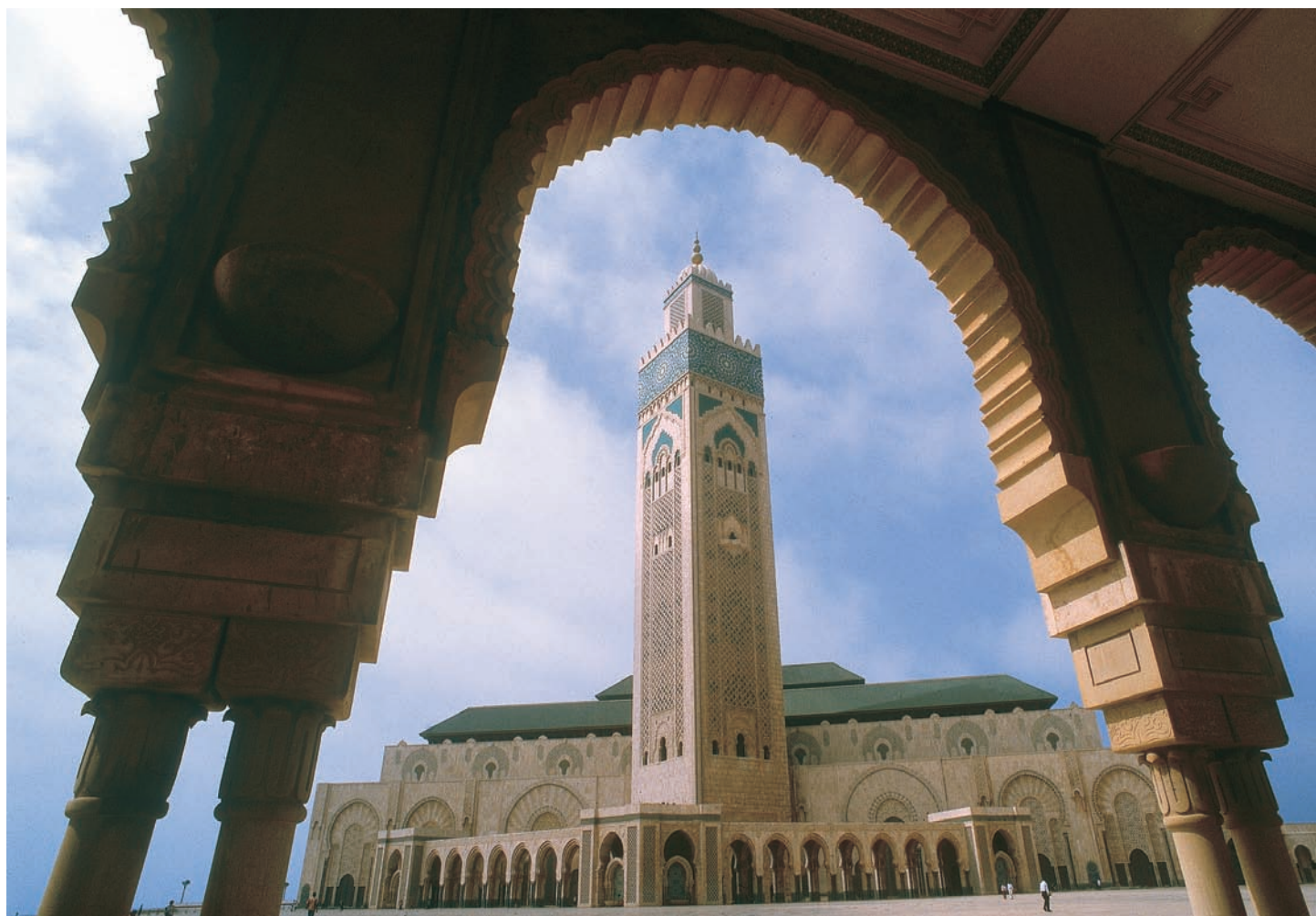
A casablancai Nagymecset az iszlám világ második, Afrika legnagyobb Iszlám épületegyüttese.

CASABLANCÁBAN csak pár órára állunk meg, hogy megcsodáljuk Afrika legnagyobb mecsetét, a II. Hasszánt. Monu-