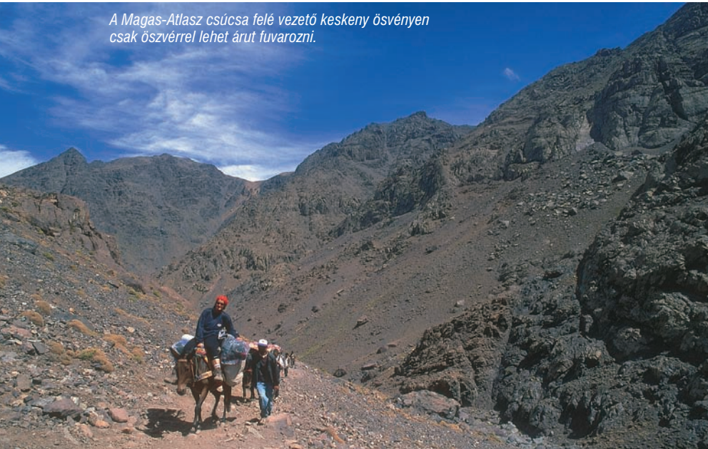
A Magas-Atlasz csúcsa felé vezető keskeny ösvényen csak öszvérrel lehet árut fuvarozni.

A CSÚCSON fantasztikus kilátás fogad, innen jól láthatjuk az Atlasz-hegység kopár csúcsait és völgyeit, éles szeműek akár a Szaharát is. Fölöttünk az ételmaradéokra leső csókák, és a hegymászó lányokat kukkoló siklóernyősök keringenek. A viszszaút már csak fele annyi időt vesz igénybe, mint a csúcsra vezető túra, a kora délutáni órákban már a Neltner alaptáborban főzzük leveseinket.