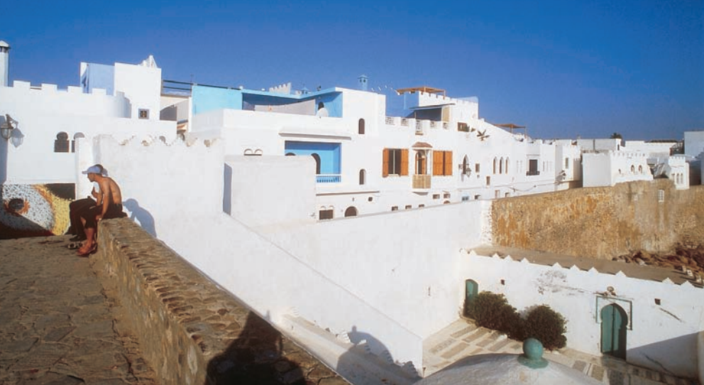
Az Atlanti-óceán partján fekvő Asilah egy csendes kisváros.

A 14 KILOMÉTER széles Gibraltári tengerszoroson átkelve alig másfél órás hajóúttal juthatunk át Ceutába. Az afrikai kontinensen lévő, de spanyol fennhatóság alatt álló város európaias és olcsó, így az útra szükséges élelmiszerek, és a fertőtlenítésre szánt alkohol beszerzésére kiváló helyszín. Marokkóra jellemző a sokszínű etnikum, mely először itt, a határon tűnik fel,