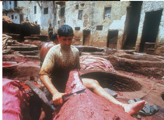
Fez a bőrművesekről is híres, a bőrcserzés a legkeményebb munkák egyike.

MIELŐTT UTOLÉRNE bennünket a legnagyobb hőség, visszaindulunk Erfoudba, ahol meglátogatunk egy ősmaradványokkal foglalkozó manufaktúrát. Pár kiló homok és csiszolt asztallap buszba pakolása után indulunk tovább északra, hogy Marokkó talán legismertebb, a Világörökség részét képező városát, Fezt is felkeressük.