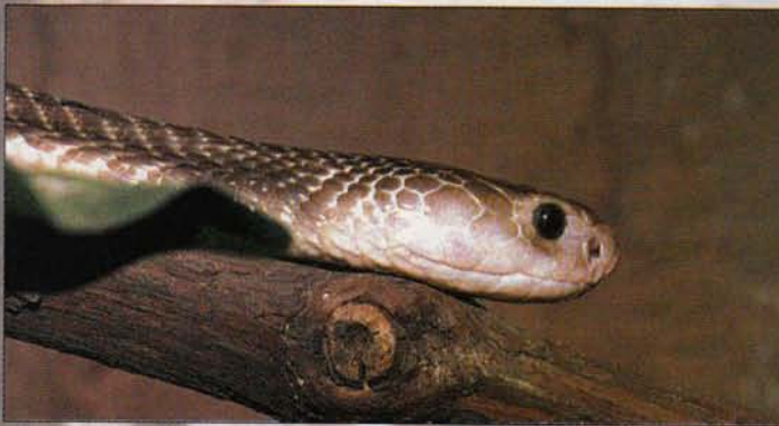
Kínai Kobra operáció nélkül