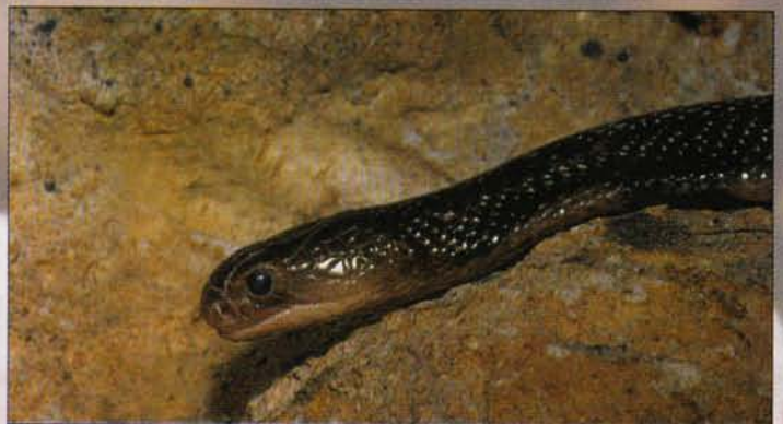
Kínai Kobra beesett arccal, operáció után

Végezetül egy jó tanács: aki teheti, kezdje ártalmatlan sikkal a terrarisztika csodálatos hobbiját.