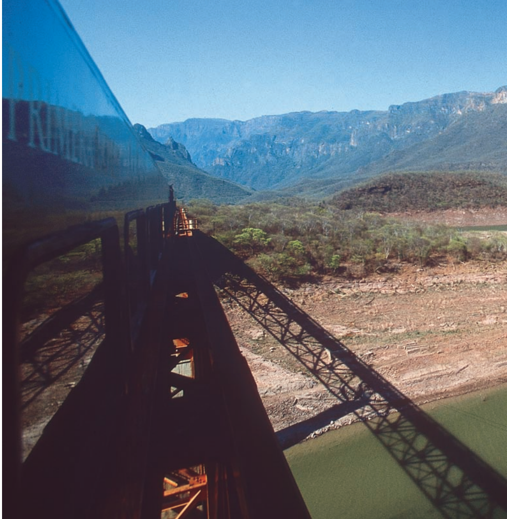
A Chihuahua Pacifico a Chinipas folyón átívelő, száz méter magas hídon ér ki a Copper kanyonból. Ez már Sinaloa állam, a folyón túl jellegzetes félsivatagi táj fogadja az „El Chepe” vonat utasait.

Kalandszerelmek számára egyenesen földi paradicsom a hely. Az évenként megrendezett nevezetes Adventure Festivalon még az indiánok is indulnak, ahol a børsaruban maratonozó tarahumara aszszonyok nevékhöz híven lefutják a tere-