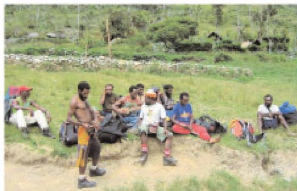
Teherhordóink pihenés közben. A turizmus eddigi kényérkereséssel lehetőséggel egyre többen igyváznak élni