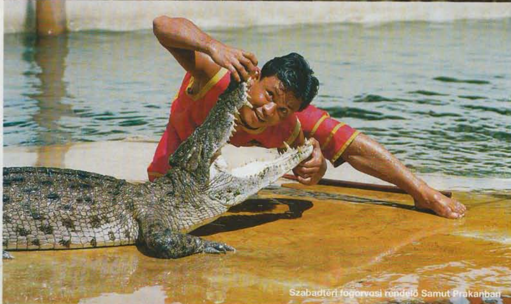
Szabadterti fogorvosi rendező Samut Prakanban

A Bangkoktól 30 kilométerre lévő Samut Prakan-i krokodilfarm fajmegőrzési céllal jött létre, mára azonban ez is leginkább a természet gyalázatos kizsákmányolásáról szól. Reggel héttől várják a 300 bahtot kiizzadni nem rest kárpát-mendencei utazót. Akit nem zavar, hogy a szereplők a műsor végeztével a vágóhídon végzik, feltétlenül várja ki a 16 órai birkózást. Addig is harmincezer krokodilban gyönyörködhet, amennyiben hinni le-