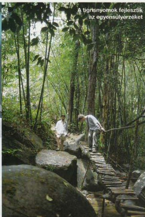
A tigrisnyomok fejlesztik az egyensúlyérzékét