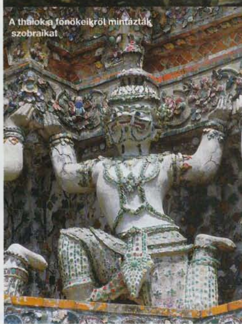
A thálok a főnökeikről mintázták szobraikat

A 80 centis átmérőjűre is meghízó dögvirág, a Rafflesia emélyítő bűze mérföldekről érezhető.