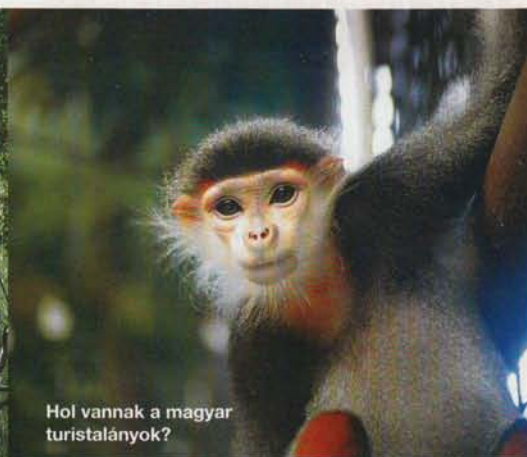
Hol vannak a magyar turistalányok?

het a prospektusban szereplő számadatoknak. Ha jót akarunk magunknak, a shopban ne vásároljunk bőrdíszműnek álcázott holttestet! Ezzel ugyanis nemcsak egy kétséges vállalkozást tartunk életben, de a természetvédelmi törvények ellen is vétünk, és Ferihegyen a bozontos szemöldökű vámtisztviselő sem fog örülni.