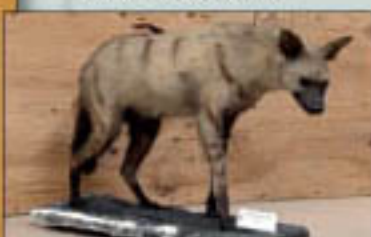
A tanzániai Ruwanda-sztyeppén lőtt cibethiána preparátuma

Magyar vadászok kíséretében jutott el utolsó, hatodik útjára, mely az akkori Belga Kongóban (ma Kongói Demokratikus Köztársaság) és Ugandában folytatott vadászaton jelentett. Selous-t, a híres angol vadászt személyes jó barátjaként tarthatta számon, értékes trófeáit Kittenberger is preparálta. Neves vadászunk még megérte az 1956-os múzeumi tűzveszt, amelyben teljesen elpusztult az általa gyűjtött mintegy 1000 hulló és kétfelhő, 2500 preparált madár és leghíresebb gyűjteménye, a 25 kítőmött nagyvadból álló, teljes Afrika-kiállítás anyaga.