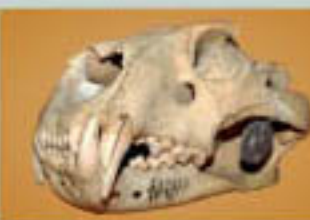
A Széchenyi Zsigmond által 1964 februárjában, a kenyai Lollokitok város közelében lőtt him oroszlán (Panthera leo) koponyája

kiállítás pódására szervezett múzeumi expedíció révén 1960-ban is eljutott Afrika; utolsó gyűjtésének ez tekinthető.