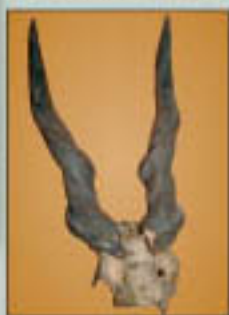
Tanzániában lőtt jávorantilop (felül) és közönséges lantszarvú antilop (alul) trófeája

Gyűjteményünkben jelenleg 10 nagyemlősfaj 17 példányát őrizzük. Ezek közül kiemelni a jávorantilop és a közönséges lantszarvúantilop trófeáit.