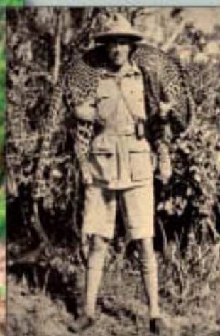
Gr. Széchenyi Zsigmond az első kenyai párducával

éppen kiadásra váró környék egyúttal. Nem csoda, ha ezután két évig a szerzőnek sem volt kedve elővenni a kéziratot és a fotókat, később a politikai helyzet nem engedte ezek kiadását. Az eredeti tervezett kiadástól számított fél évszázad múlva, a szerző születésének 90. évfordulójára végre megjelent az elpusztult trófeákat bemutató könyv, de azt csak kevesen tudják, hogy pár preparálásra váró trófea túlélte a háborút. Az 1956-ban elégett Kittenberger-féle Afrika-