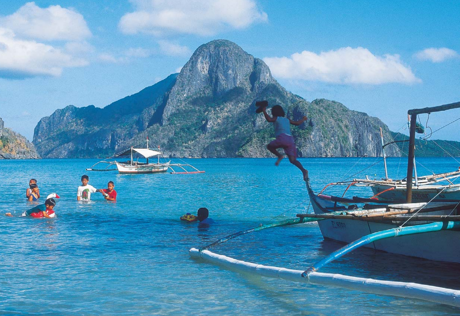
A Fülöp-szigetekre jellemző vendégoldalas halászhajó a szigetek közti nagy távolságok viszonylag gyors megtételére alkalmas.

CALAMIAN SZÉPSÉGEI némiképpen kárpótoltak, de továbbra sem mondtam le arról, hogy a Fülöp-szigetek utolsó erdeit is megpillantsam. Utam utolsó állomásaként Luzon szigetére érkeztem, itt található Manila, a főváros is. Buszom éjszaka haladt el a legendás Pinatubo vulkán mellett,