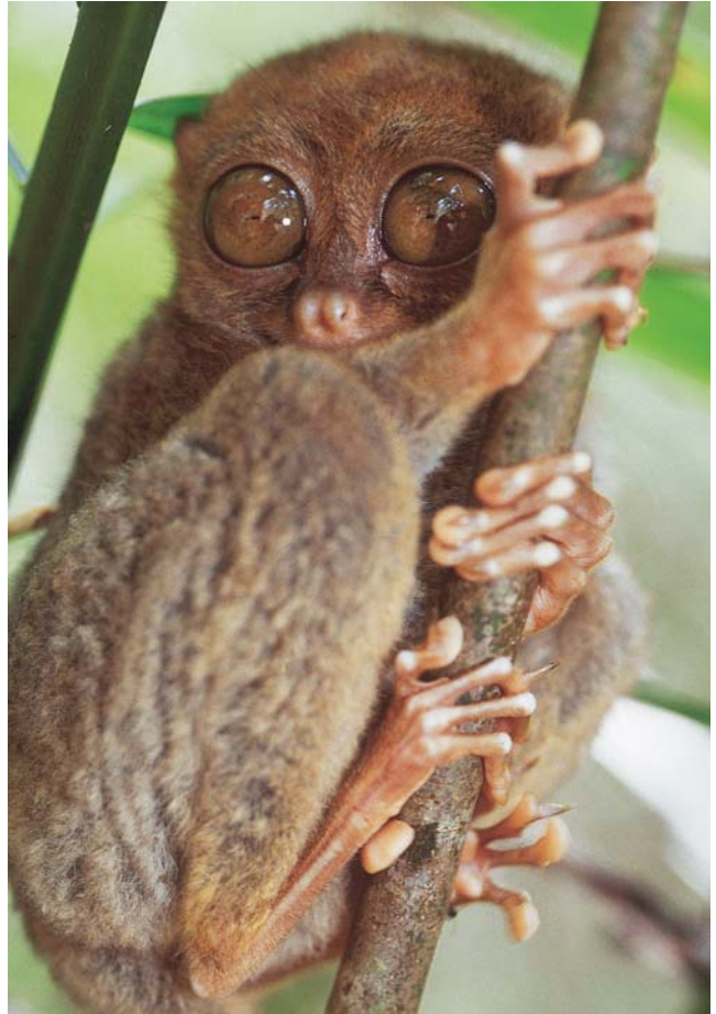
A ritka Fülöp-szigeteki koboldmaki egy fiatal példánya.

városában folytattam. Útközben megtudtam, hogy a sziget 85%-án már elpusztultak a zátonyok, a bűvárturistáknak nem maradt más, mint a környéken 1944-ben elsüllyesztett japán hajóroncsok, melyek mesterséges korallzátonyokként szolgálnak látnivalóul. A roncson megtelepült korallzátony