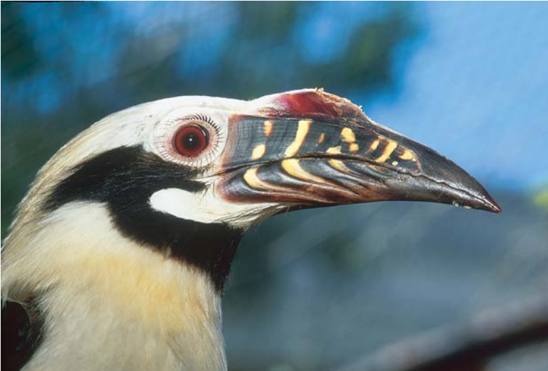
A Panay-szigetről származó visayai szarvasszórú madár csak a Fülöp-szigeteken él, endemikus faj.