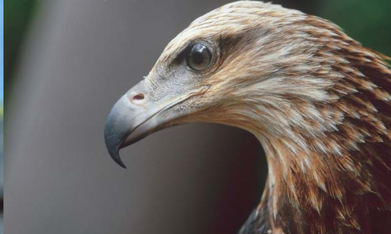
Febérmellű halászsas egy sérült példánya, melyet palawani biológusok ápolnak.