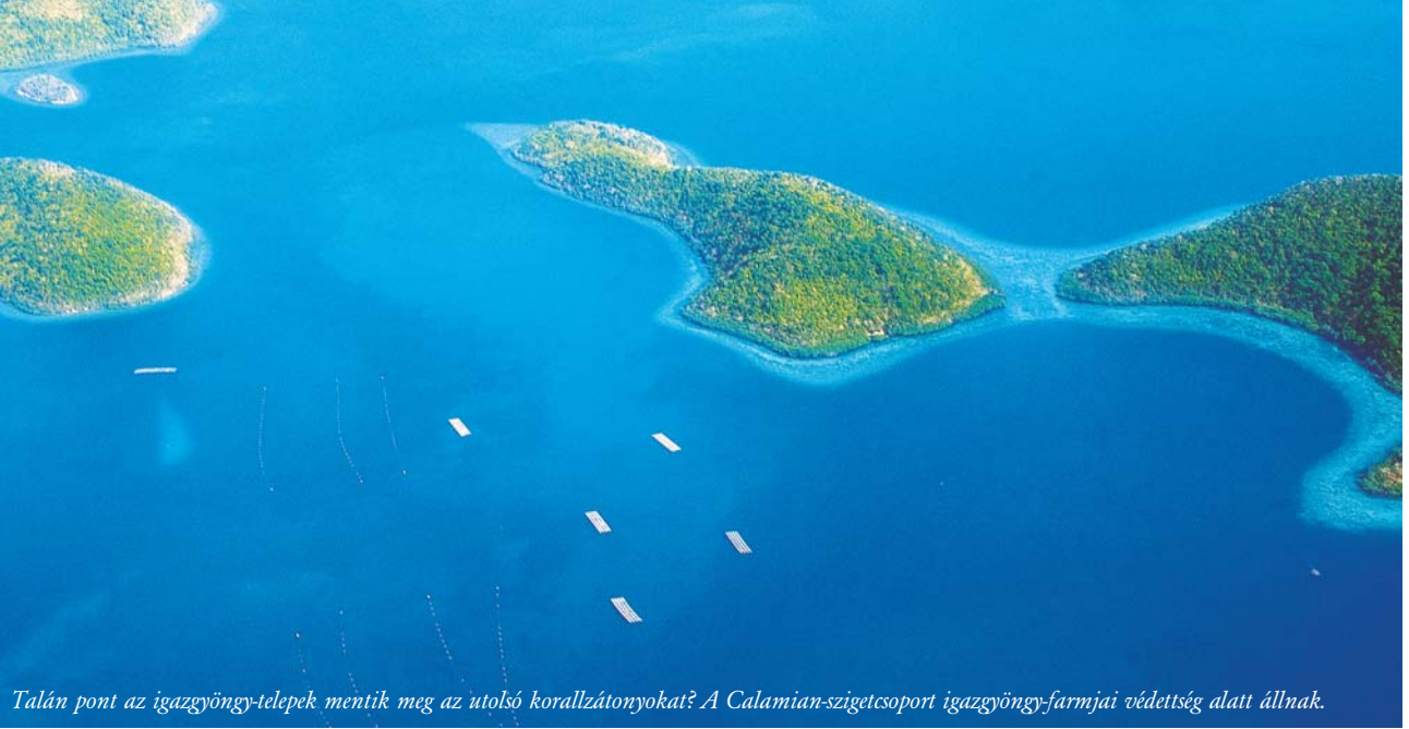
Talán pont az igazgyöngy-telepek mentik meg az utolsó korallzátonyokat? A Calamian-szigetszoport igazgyöngy-farmjai védetség alatt állnak.

körül rengeteg a hal, köztük egészen különlegesek is vannak. A Thai Maru tankernél merülve én is megnéztem az apró szigetek között megbúvó, védetségét élvező igazgyöngy-farmokat. Aki viszont itt megáll vagy halászni próbál, arra az őrség tüzet nyit a közeli toronyból.